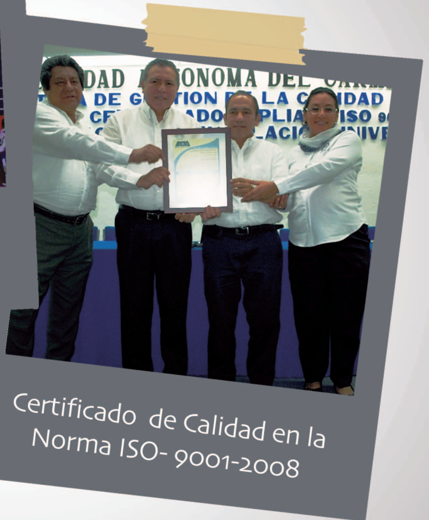
Certificado de Calidad en la Norma ISO- 9001-2008