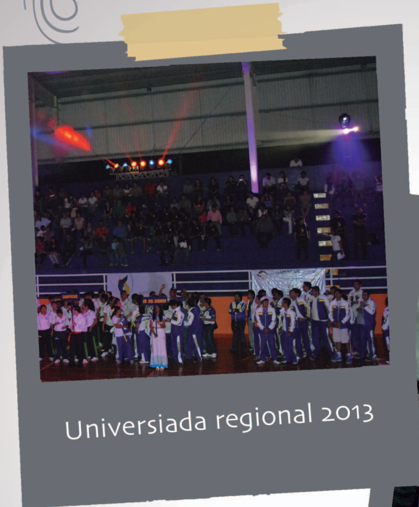
Universiada regional 2013